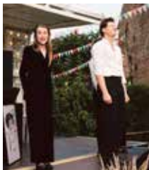
Die Daffkes