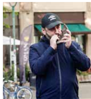
Rosch ha-Schana

In Kooperation mit dem Leo Baeck Institute Jerusalem. Mit freundlicher Unterstützung des Leibniz-Institut für jüdische Geschichte und Kultur – Simon Dubnow