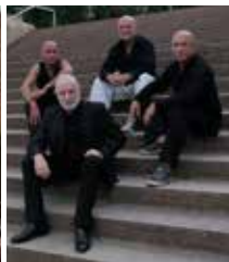
K. Kaufmann & Klangprojekt ©Silvia Hauptmann