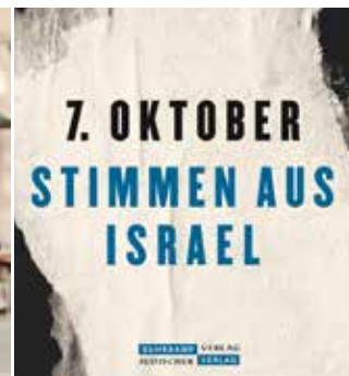
Der Almanach zum 7. Oktober