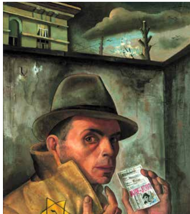
Felix Nussbaum (Selbstporträt mit Judenpass in Auschwitz)

Die Ausstellung ist bis zum 7. Februar sichtbar und ist Montag bis Donnerstag von 14.00 bis 18.00 Uhr bei freier Saalkapazität für BesucherInnen geöffnet.