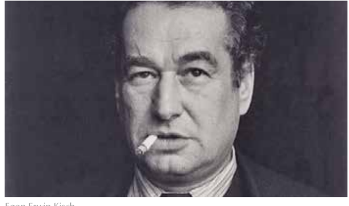
Egon Erwin Kisch