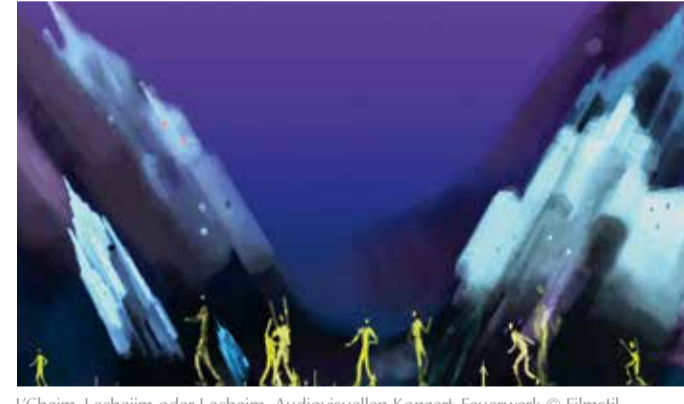
L'chaim, Lechajim oder Lachaim /Audiovisuelles Konzert-Feuerwerk