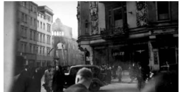
Blick auf die zerstörte Große Gemeindesynagoge, Gottschedstraße/ Zentralstraße, 1938