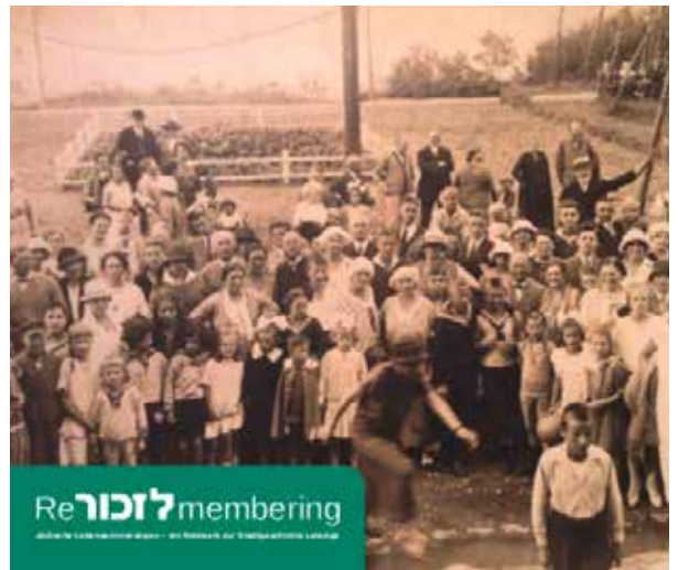
Projekt Remembering

*Teile des Programms finden vorbehaltlich einer beantragten Förderung statt.