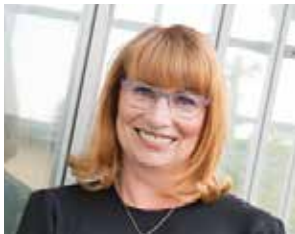
Petra Köpping